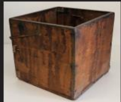
陸軍の宿舎で使われた木製漬物入