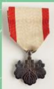
勲八等 白色桐葉章