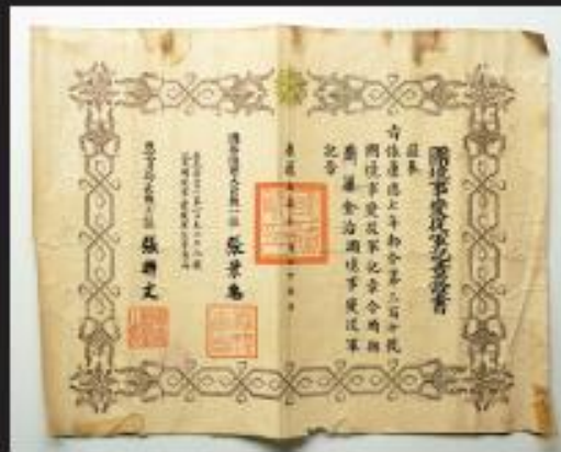
国境事変従軍記章証書