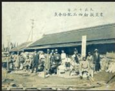
関東大震災救助物品配給委員の写真