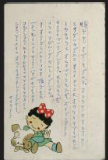
戦地から姪へ送られたはがき

平成29年度には、17名の方から新たに貴重な資料555点を御寄贈いただきました。本展では、その中から主な資料を初めて紹介いたします。戦時中の人々に思いを馳せ、平和の尊さを考える機会となりましたら幸いです。