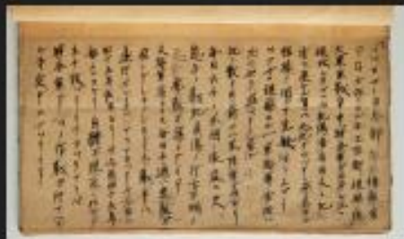
手記「米軍日本々土ニ進攻セバ」

埼玉県平和資料館では、平成5年の開館以来、戦争の悲惨さと平和の尊さを後世に伝えるため、戦争に関する資料や戦前から戦後期の生活用具などについて、調査・収集・保存・展示を続けてきました。