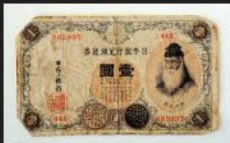
日本銀行兌換銀券