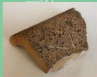
長崎で被爆した瓦